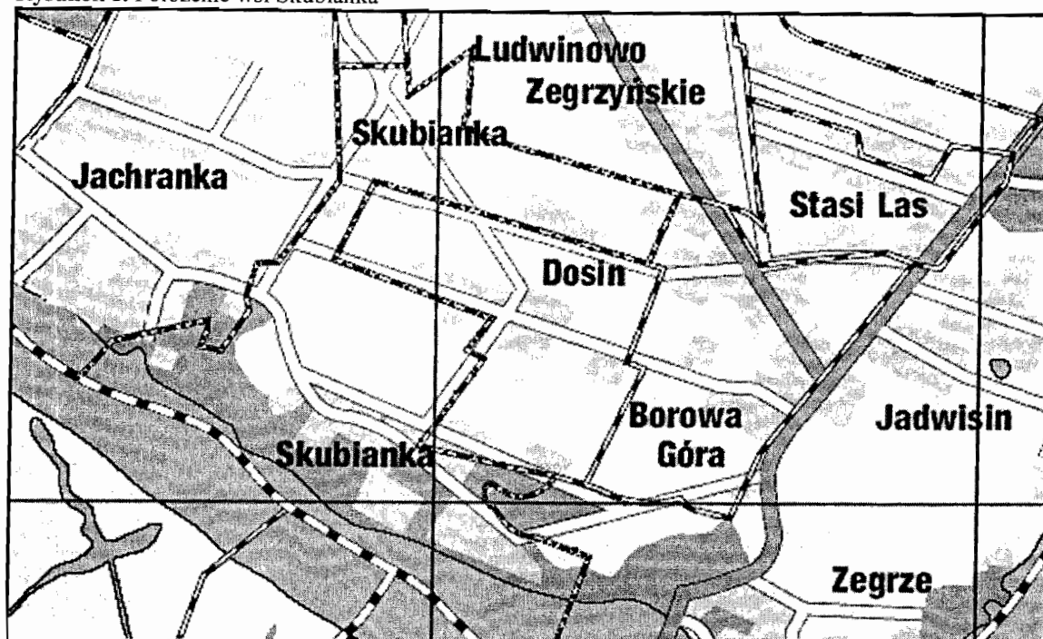
Rysunek 1. Położenie wsi Skubianka