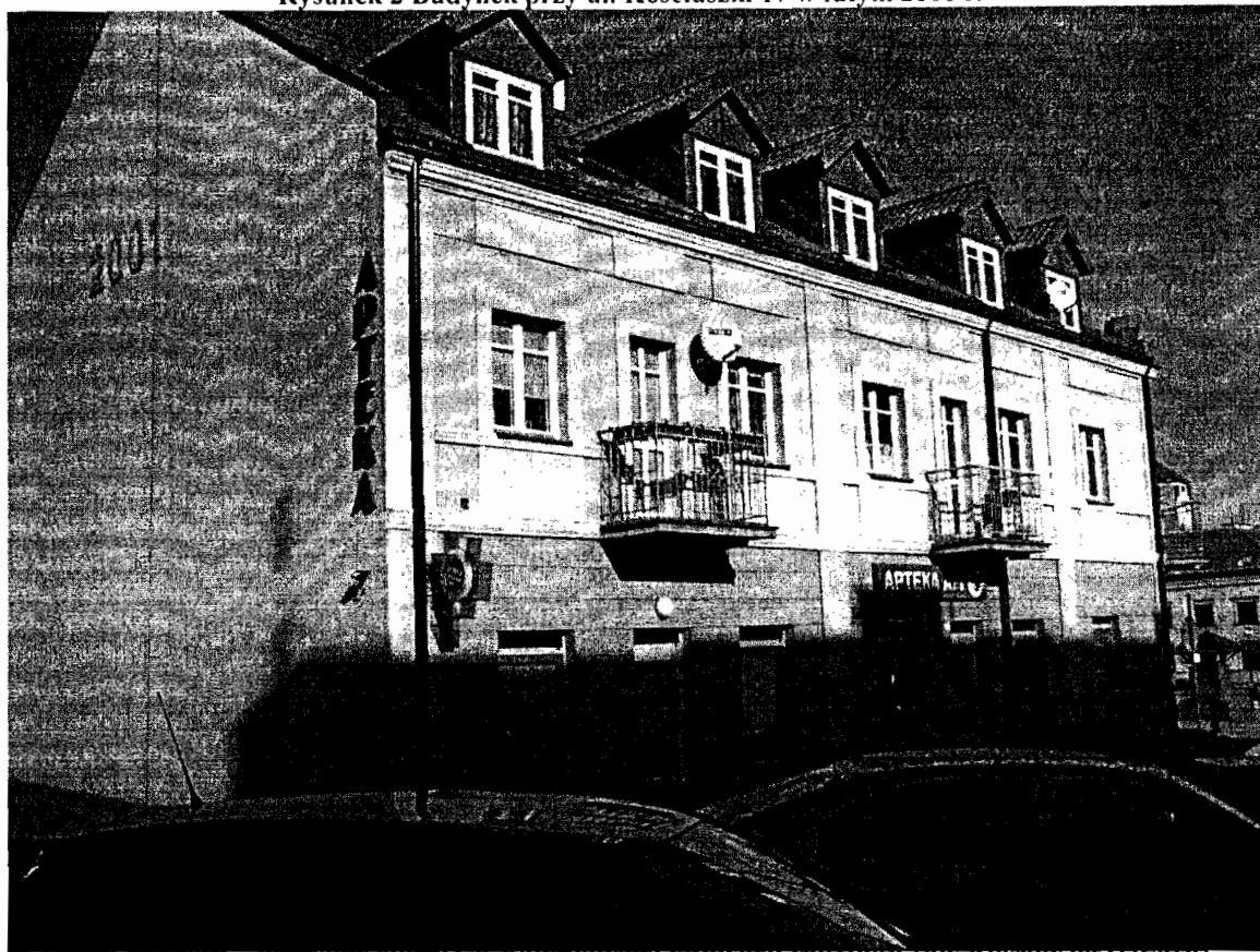
Rysunek 2 Budynek przy ul. Kościuszki 17 w lutym 2011 r.