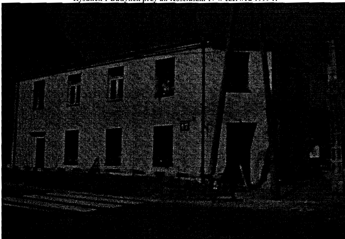
Rysunek 1 Budynek przy ul. Kościuszki 17 w czerwcu 1999 r.

W 2001 roku w tym miejscu stanął całkowicie nowy obiekt mieszkalny, powstały po rozbiórce dotychczasowego.