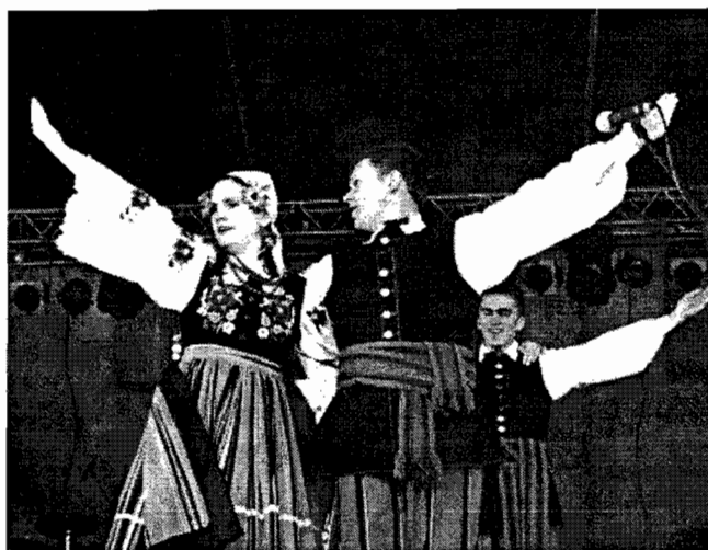
Rysunek 1. Ludowy Zespół Artystyczny „Serock”, występ w trakcie Święta Patrona Serocka - Świętego Wojciecha 2007

W mieście działa Klub Aktywnego Seniora, który organizuje czas wolny starszym mieszkańcom gminy.